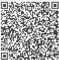
QR-Code Rekening Kemanusiaan GKI Manyar

Bantuan dapat disalurkan melalui rekening BCA 464-3125-300 atau melalui QR Code Rekening Kemanusiaan GKI Manyar dengan menyantumkan "Aksi Puasa Prapaskah" atau melakukan transfer dengan nilai nominal 40 pada dua angka terakhir .